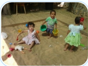
Le jardin d'enfant

La Crèche prend à sa charge, malgré leur coût prohibitif, certaines interventions et soins hautement spécialisés qui ne peuvent pas être assurés sur place.