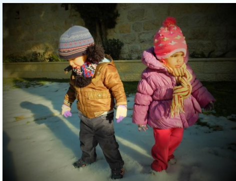
Noël 2013 sous la neige